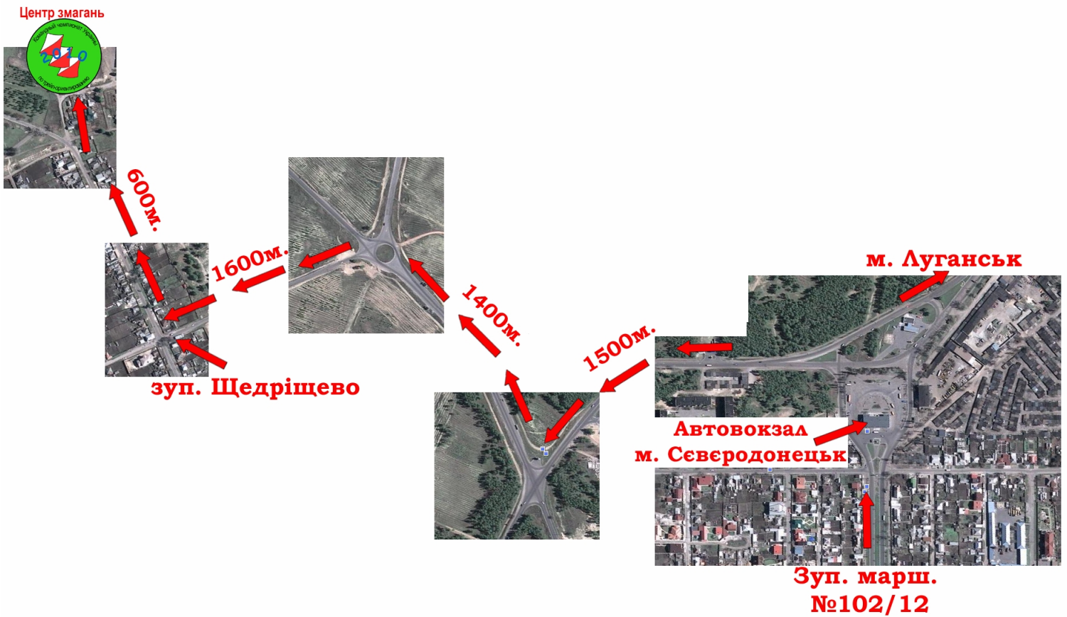
Схема взята з бюлетня командного чемпіонату України з трейл-орієнтування