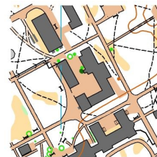
Суперспринт М 1:5000 Н=2,5 м.

ПАРАМЕТРИ ДИСТАНЦІЇ: згідно з чинних правил.