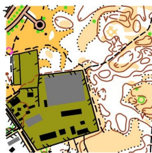
Коротка дистанція та естафета М 1:10000 Н=2,5 м.